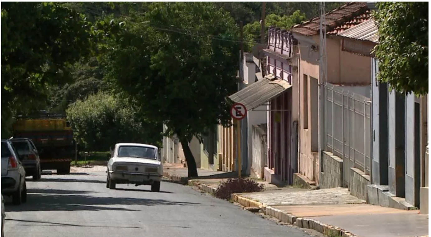
Taquaritinga está na fase vermelha do Plano SP

De acordo com o último boletim epidemiológico, a cidade soma 2.503 casos de Covid-19 e 65 mortes desde o início da pandemia.