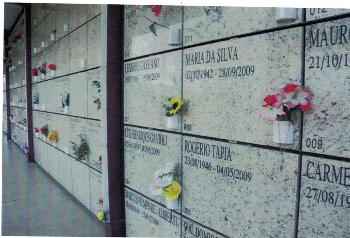
Figura 1 - Belo Horizonte – MG