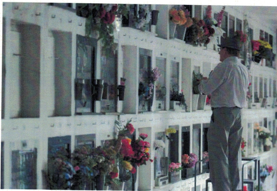
Figura 3 - Porto Alegre – RS