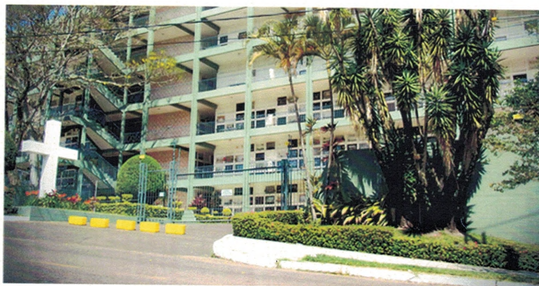
Figura 2 - Porto Alegre - RS